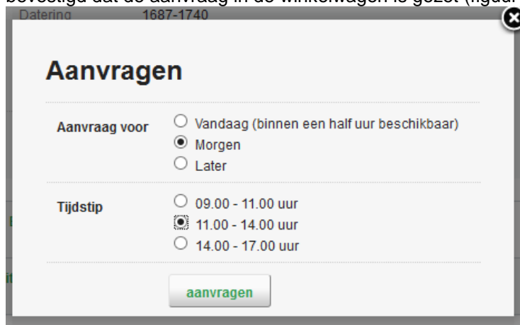
Figuur 3. Voorbeeld scherm invullen inzagedatum