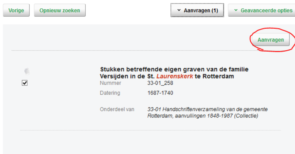
Figuur 2. Voorbeeld opengeklapt venster samenvatting aanvraag

te zien. Neem contact op met één van de studiezaalmedewerkers.